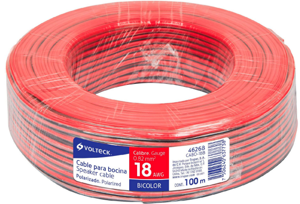
Rollo de 100 m