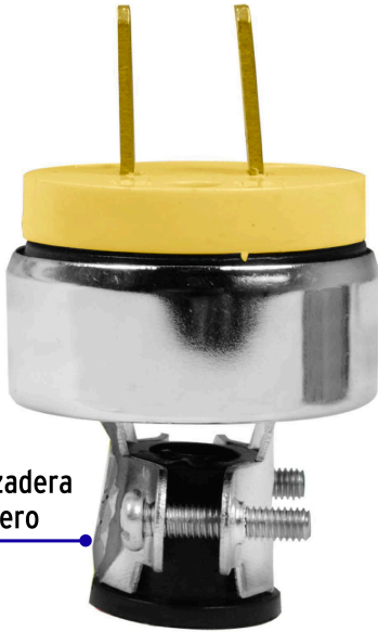
Abrazadera de acero