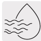
Aplicación húmedo y seco