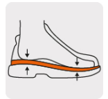
Plantilla que absorbe el impacto