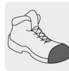
Casquillo de poliamida