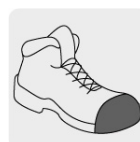
Casquillo de poliamida