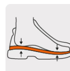
Plantilla que absorbe el impacto