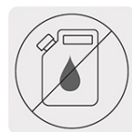
Libre de mantenimiento