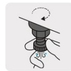
Válvula de drenado