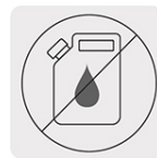
Libre de mantenimiento por cambio de aceite