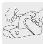
Operación a dos manos