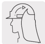
Fijación hook and loop