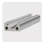
Metales no ferrosos