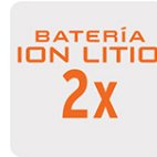
Más tiempo de vida Mayor velocidad de carga