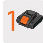
Incluye batería ion litio