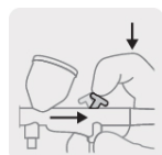
Control de aire y flujo de pintura