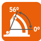
Capacidad de biselado