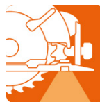
LED para iluminar