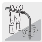
Para compactar el concreto